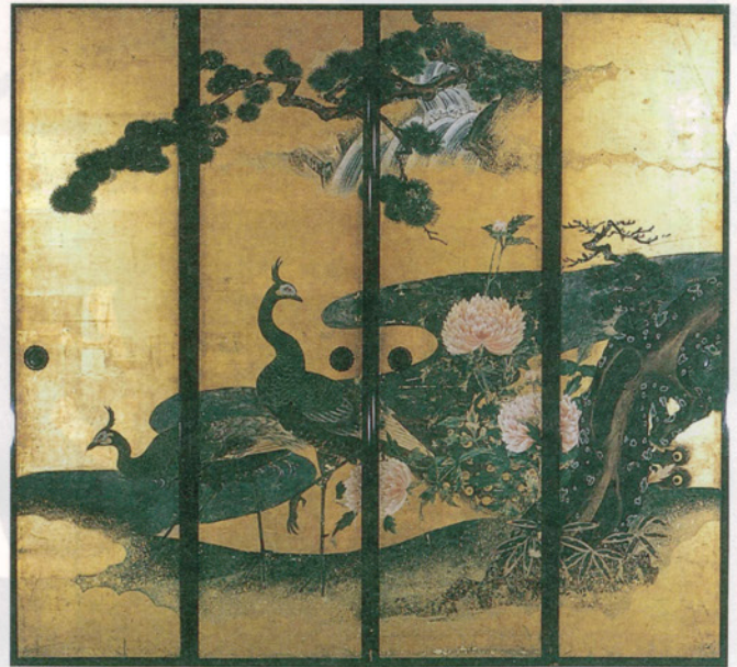
壽山楽屋襖「孔雀牡丹図」

長浜曳山祭の曳山やそれを飾る装飾品には、色々なところに花がちりばめられています。特に幕類や舞台障子、楽屋襖に、菊や芙蓉、牡丹など美しい花々が数多く描かれています。長浜曳山祭といえば、子ども狂言（歌舞伎）が一番の見所として注目されますが、その子ども狂言の魅力を最大限に引き立たせているのは、曳山本体に加えて、曳山を飾る幕類や舞台障子などの装飾品です。本展示では、そうした装飾品にスポットをあて、普段見ることの出来ない、また間近で見ることのできない装飾品をご紹介します。この展覧会を通して、曳山の色々な場所に描き出された珠玉の花々をご覧いただき、長浜曳山祭の曳山の魅力を再認識していただければ幸いです。