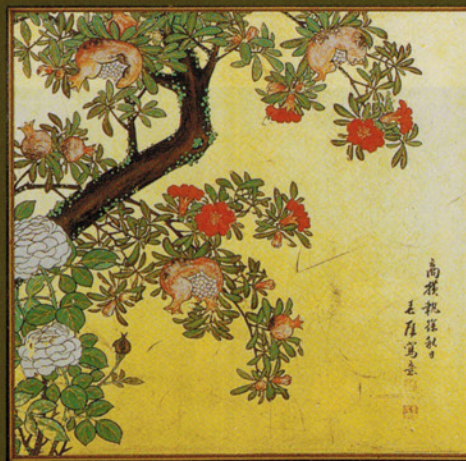
壽山舞台障子腰襖「石榴小禽図」(部分)