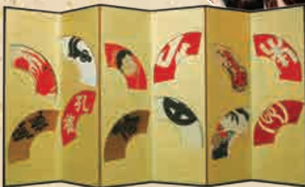
山組扇面貼交屏風