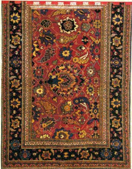
鳳凰山胴幕「中東連花葉文様」

長浜曳山祭といえば子ども狂言(歌舞伎)が一番の見所として注目されますが、その魅力を最大限に引き立たせているのは、曳山本体に加えて、曳山を飾る美術品の数々です。本展示では、普段間近で見ることの出来ない稀々の花々が数多く描かれている幕類や舞台障子、楽屋襖などをご紹介させていただきます。この展覧会を通して、珠玉の花々をご覧ください、長浜曳山祭の曳山の魅力を再認識していただければ幸いです。