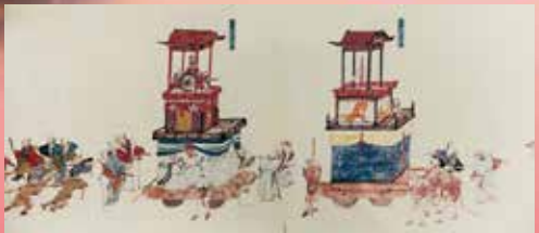
▲ 高山山王祭行列絵巻(複製)【第1会場】

展示説明会 ※聴講には入館料が必要です。 第1会場 日時：平成27年3月18日(水) 午後1時30分～ 会場：長浜城歴史博物館 2階展示室 第2会場 日時：平成27年3月14日(土) 午後1時30分～ 会場：長浜市曳山博物館 1階展示室