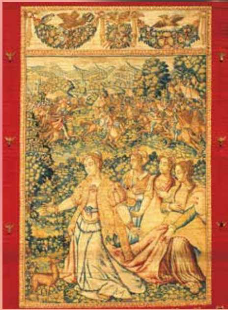
▲ 長浜祭鳳凰山飾毛繰 見送幕【重文】 【第2会場】 ■展示期間：平成27年3月9日(月)～4月3日(金)■