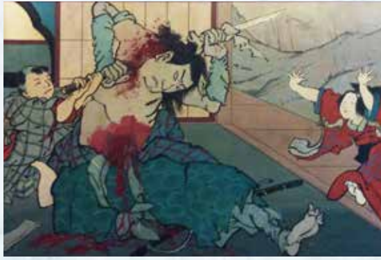
巨大布絵看板 絵本太功記から杉の森とりでの段(部分) 187.5×363.5 (cm) ミュージアム中仙道蔵

特別出陳である長浜の画家、 清水節堂の描表装という手法 で描かれた、掛け軸から幽霊 が抜け出てくるだまし絵は一 度見たら忘れられないトリッ クに満ちている。