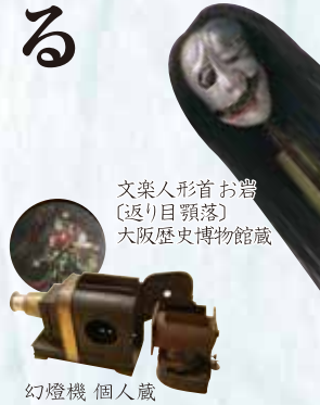
文楽人形首お岩 [返り目顎落] 大阪歴史博物館蔵