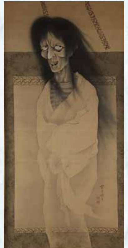
絹本淡彩幽霊図(清水節堂画) 徳源院蔵