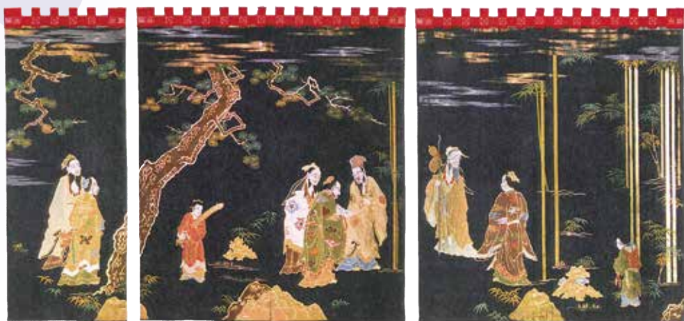
長浜曳山祭の曳山行事 壽山胴幕と奥屏幕「竹林七賢人図」