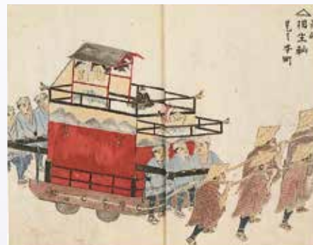
大垣祭 月岡画帖 八幡宮御祭礼御行列番付大略画 (部分) 大垣市教育委員会蔵

大垣祭の輦は濃尾震災、終戦間際空襲によって多数の輦を失いましたが、その後、復活を果たし、現在では13両の輦が城下町を巡行し、華麗な祭絵巻を繰り広げます。そして今年3月、東西の祭文化の融合と藩主戸田氏下賜の輦という両面から評価を受け国指定重要民俗文化財に指定されました。同時に「長浜曳山祭の曳山行事」を含む「日本の山・鉦・屋台行事」とともにユネスコ無形文化遺産登録候補になり、来年11月、晴れて登録される予定です。本展示では曳山を通じて文化的つながりも多い長浜のすぐお隣の岐阜県大垣市の大垣祭を紹介します。また長浜曳山祭の壽山の胴幕、大垣祭の相生輦の見送り幕、そして伏見稲荷大社の天狗輦(山車)の見送り幕が共通であるという点にも注目し、その縁を探ることにしました。残念ながら相生輦の見送り幕は焼失してしまいましたが、その一端を確認できるという期待を胸に抱きながら企画いたしました。どうかこの機会に曳山文化の多面性と絆の深さについて再認識いただければ幸いです。