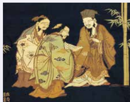
稲荷祭山車「天狗輦」懸装品 松竹高士図見送り幕 (部分) 伏見稲荷大社蔵 (京都市指定有形民俗文化財)