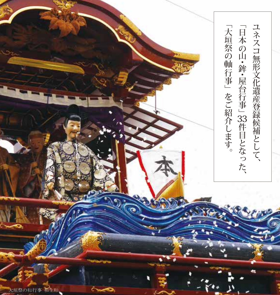
大垣祭の軸行事 相生軸

ユネスコ無形文化遺産登録候補として、「日本の山・鉦・屋台行事」33件目となった、「大垣祭の軸行事」をご紹介します。