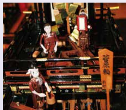
大垣祭 菅原輦模型 (部分) 個人蔵