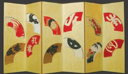
山組扇面貼交屏風