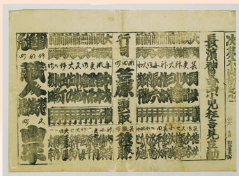
長濱神事曳山小兒狂言見立角力