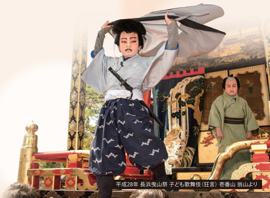
平成28年 長浜曳山祭 子ども歌舞伎(狂言) 壱番山 翁山より