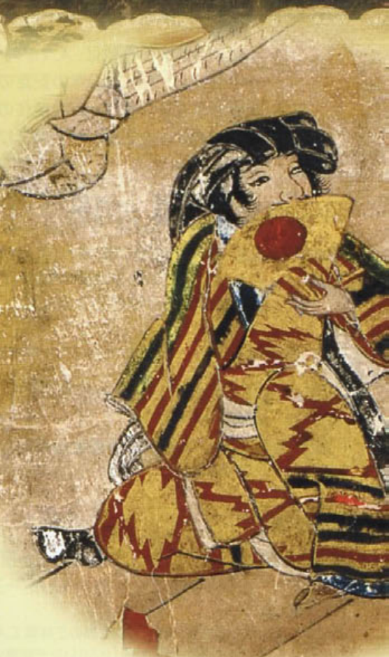
阿国歌舞伎草紙(部分) 大和文華館蔵