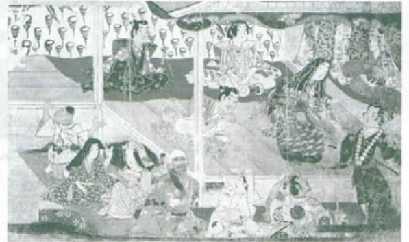
阿国歌舞伎草紙(重要美術品) 大和文華館蔵