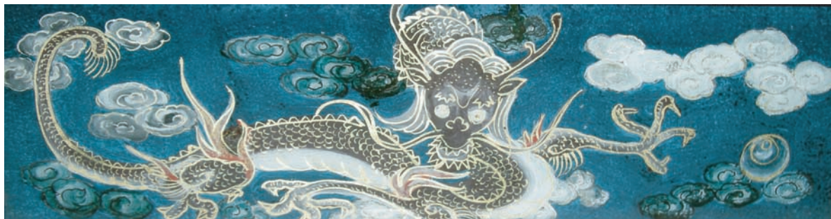
■月宮殿亭宝玉台座ガラス絵「龍図」