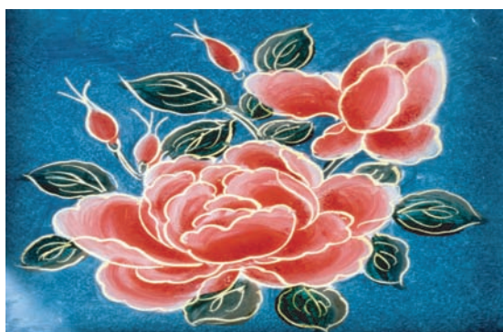
■月宮殿亭窓ガラス絵「花鳥図」部分