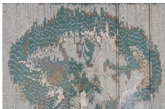
■孔雀山亭玉簾「龍図」

長浜曳山祭の曳山月宮殿の曳山博物館への修理ドック入りや黒壁20周年事業の展開を機に、曳山をきらびやかに彩る工芸品の中で、ガラスに焦点をあてた特別展を開催します。今回の特別展では、月宮殿の亭屋根に輝く宝玉、宝玉露盤に描かれたガラス絵、孔雀山亭のガラスの玉簾など、普段は見ることのできない珍しい飾りを紹介します。