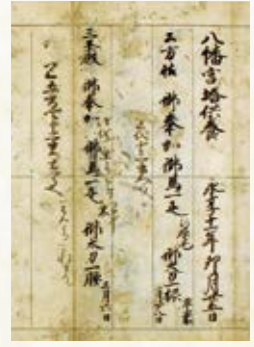
永享十一年塔供養奉加帳(部分) 滋賀県指定文化財