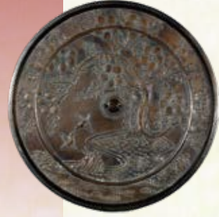
梅樹双雀文鏡 滋賀県指定文化財