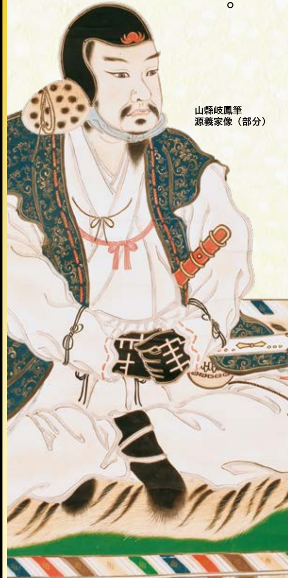
山縣岐鳳筆 源義家像(部分)