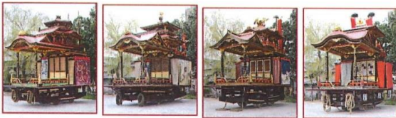
げっきゆうでん 月宮殿 かんこざん 諫鼓山 せいかいざん 青海山 かすがざん 春日山