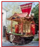
しょうしょうまる